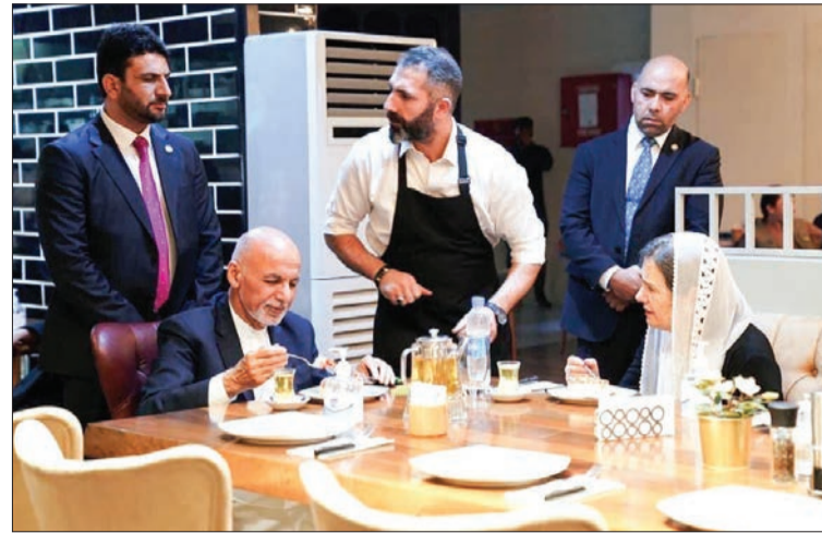
در روزهای گذشته تصاویر حضور اشرف غنی، رئیس‌جمهور افغانستان به همراه همسرش در یک رستوران در کابل مورد توجه افکار عمومی افغانستان قرار گرفته است

حرف‌های متناقض طالب‌ها درباره آینده رئیس‌جمهور فعلی افغانستان