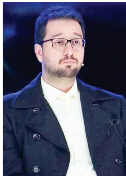
زندگی خصوصی بشیر

چه فرجامی رقم خورد؟ مهران مدیری در پلاتوی مفصل خود در ابتدای یکی از برنامه‌های دورهمی، به اشتباهاتی که بیننده‌ها تذکر داده بودند، اشاره کرد و گفت باز هم اشتباه پیش می‌آید و باز هم صادقانه عذرخواهی خواهد کرد. گیر شورای نظارت به دورهمی هم در حد یک مصاحبه رسانه‌ای بود!