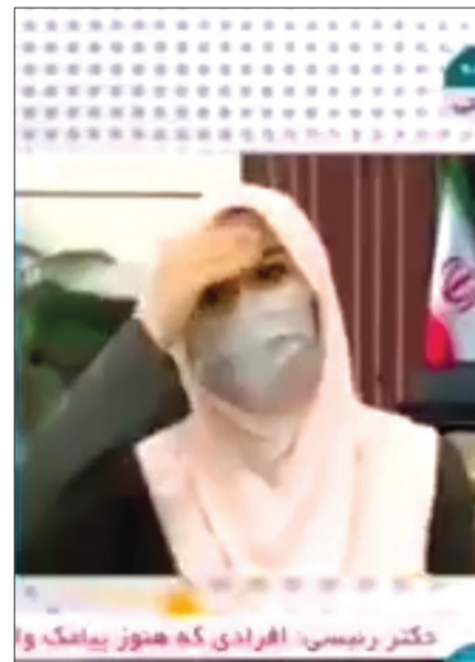
عصبانیت خانم گزارشگر

چه فرجامی رقم خورد؟ در کنشاکش اختلاف‌ها خبر رسید که تهیه‌کننده و کارگردان زخم کاری جلسه‌ای با مسئولان ساترا در حضور خبرنگاران برگزار کرده‌اند. چند روز بعد قسمت هفتم به دست مخاطبان رسید.