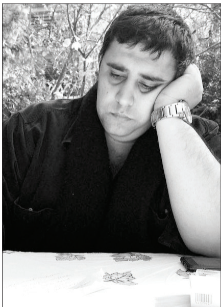
اعتراض به سبک نعمت‌الله

چه فرجامی رقم خورد؟ ماجرا چند روز بعد به پایان رسید.