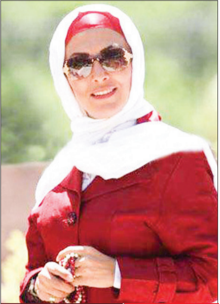
بازگشت پر سر و صدای زیلا

بازخوانی همه حاشیه‌ها و جنجال‌هایی که در نخستین ماه تابستان ۱۴۰۰ شاهد بودیم؛ از کنایه عجیب محمدزاده به یک سریال تاروهای پر حادثه مهران مدیری و دیگران