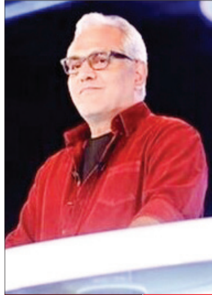
اشتباهات سریالی مدیری