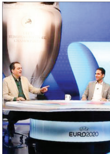
ترجمه‌های پر نامه پورو