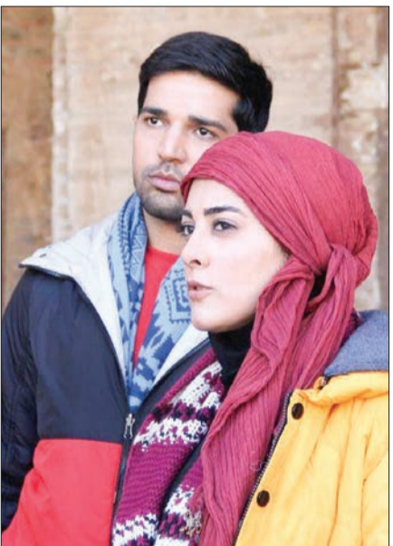
ممیزی‌های زندگی زیباست