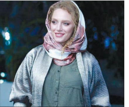
نگین معتضد در اکران فیلم سینمایی کارت پرواز.