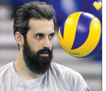
کپشن زنده‌باد سعید معروف برای این عکس در اینستاگرام رضا گلزار.