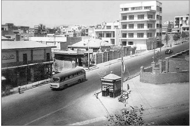
خیابان پهلوی (ولیعصر) دوراهی یوسف آباد سال ۱۳۳۹ (پنجره‌ای به دیروز)